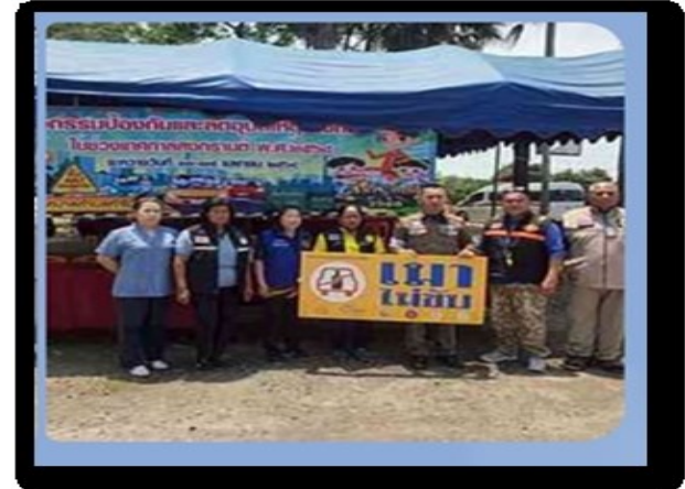
๑๓. โครงการทำไม้ร่วมใจต้านภัยยาเสพติด