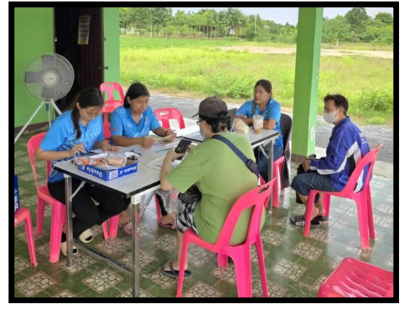
๑๗. โครงการให้ความรู้ผู้มีหน้าที่เสียภาษี ตาม พรบ.ภาษีที่ดินและสิ่งปลูกสร้าง พ.ศ. ๒๕๖๒ ภายในเขตเทศบาล